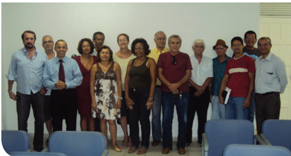
Diretores da BASES e Participantes em encontro na cidade de Feira de Santana

A edição 2011 do programa já esteve nas cidades do Rio de Janeiro, Feira de Santana, Alagoinhas, Itabuna,